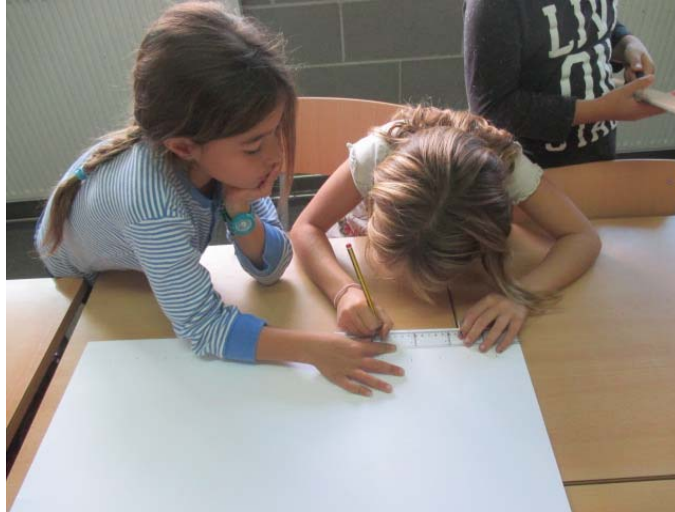
Representació de l'hort en pla.

Els costa molt aconseguir la proporció adequada per a dur-ho a terme. Per tant, decidim arrodonir les mesures. Després de realitzar diversos càlculs, hi ha un grup que aconsegueix encabir l'hort dins la cartolina de manera proporcional. Són aquests alumnes qui transmeten el seu descobriment a la resta de companys.