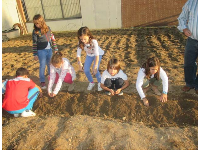
Organitzant les feixes de l'hort.

Quan van acabant estan satisfets de la feina realitzada, ja que han aconseguit l'objectiu que ens proposàvem: aconseguir una millor organització del terreny, per tal d'aconseguir un procés de plantació i de recollida més eficient.